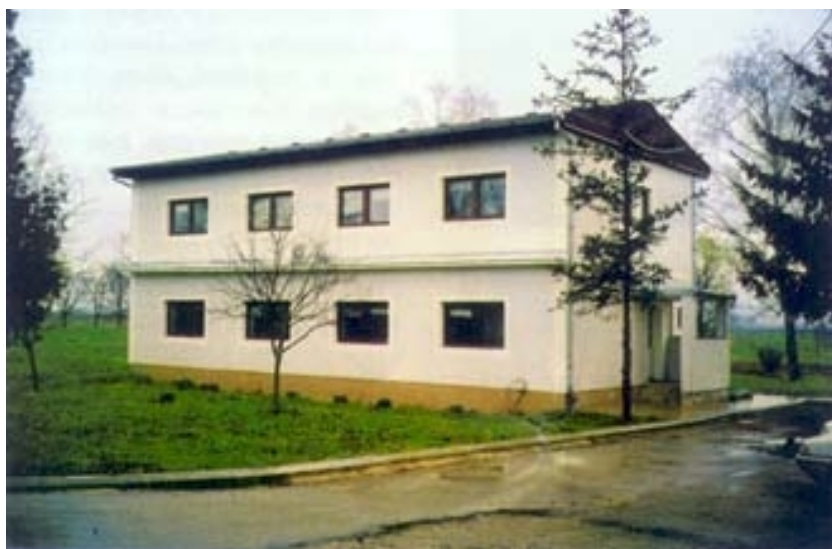
Zgrada novog laboratorija

PVC stolarije s umetkom galvanski zaštićenog čelika. Od posebnog su čelika i samostojeći rezervoari kisika. Svi su zidovi obloženi toplinskom izolacijom i žbukani grubom i završnom žbukom. Visina je dijelova građevine 12,3 m, a povišenog dijela 16,1 m.