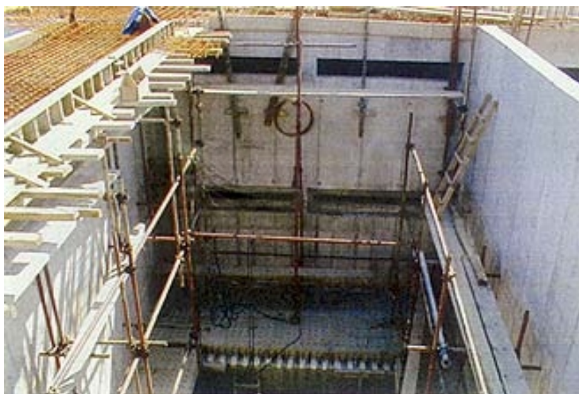
Izgradnja zgrade uređaja u lipnju 2000. godine

Nominalni je projektirani kapacitet postrojenja za preradu vode, smještenog u blizini starog i još uporabljivog uređaja, 330 l/s, a najveći 360 l/s. Voda se crpi vodozahvatom na zdencima, kojih ima ukupno 8, na dubini od 60-70 m, a prosječna je udaljenost od zgrade 300 m. Voda potom dolazi u prethodnu ozonizaciju, gdje se za to rabi otpadni plin iz glavne ozonizacije. Tako se povećava sadržaj kisika u vodi i na taj način oskidiraju željezo i mangan koji se talože u obliku malih pahuljica. Ujedno oksidiraju i neki organski sastojci, a izdvajaju se ili oskidiraju i hlapive tvari koje utječu na okus i miris, poput vodikova sulfida. Voda potom odlazi do dvomedijjskih filtera u kojima se odvajaju krute čestice, ali i dio bioloških organskih sastojaka. Filtracijski se dio sastoji od četiri dvomedijjska filtra u kojima je ispunjena od hidroantracita i filtera-