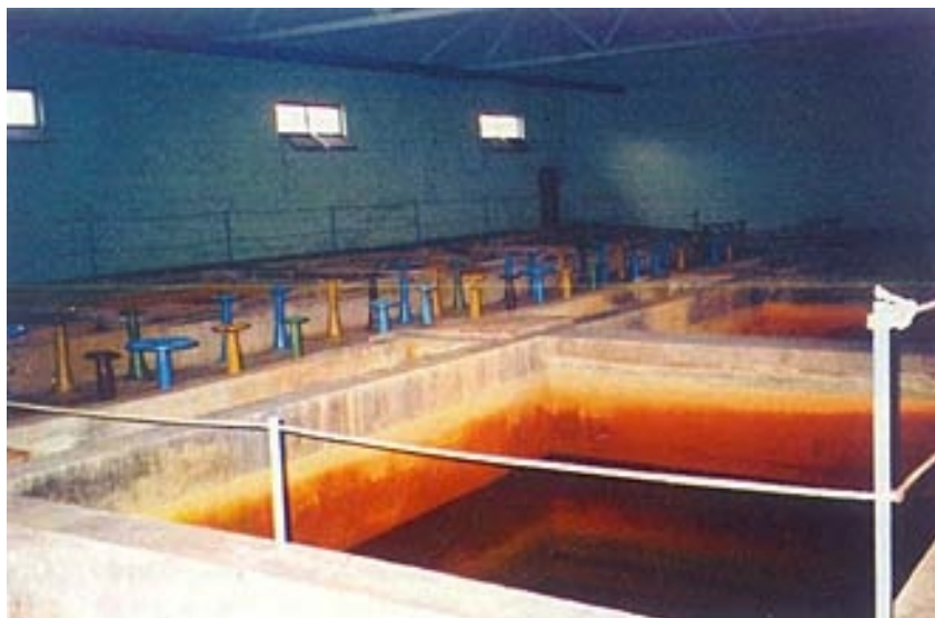
Staro postrojenje za preradu vode

skog pijeska (visine od po 0,8 m) i nosivi šljunčani sloj od 0,1 m. U dnu svakog filtra izvedeno je više otvora koji služe za odvod obrađene vode, za ulaz vode za filtarsko ispiranje te zraka za rahljenje.