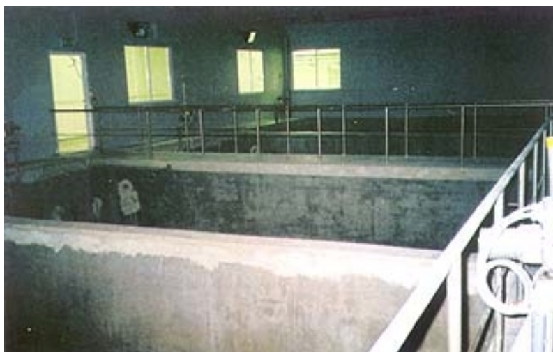
Komore za predozonizaciju