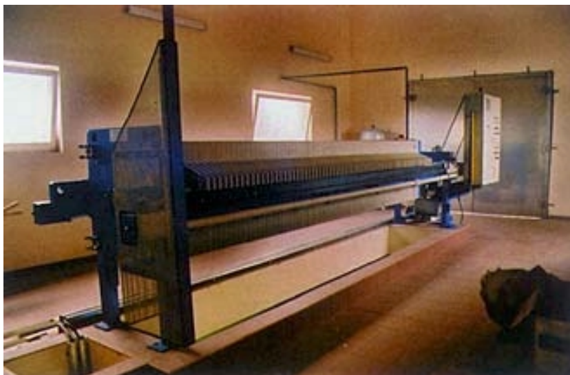
Dio sustava za preradu mulja

Nova je zgrada, u kojoj inače u punom pogonu neće biti radnika jer će se cijelim procesom upravljati daljinski, smještena je u zapadnom dijelu crpilišta i u obliku slova je L. Sastoji se od tri posebne dilatacije. U prvoj se u prizemlju nalazi strojnica, kemijska prostorija, bazen za ispiranje, skladište i prostorija s električnim postrojenjima. Na prvom se katu nalaze dvomedijski filtarski bazeni s pripadajućim preljevnim kanalom i s bazenom za predozonizaciju. Na drugom je katu kontrolna soba odijeljena zidom i fiksnim prozorima. U drugoj su dilataciji u prizemlju smješteni filtri s aktivnim ugljenom i bazen s glavnom ionizacijom, a na katu je prostorija za doziranje ozona i priključak na rezervoar za kisik i kontrolna soba s galerijom. U trećoj se nalazi ulazni prostor sa stubištem, prostorija s kontejnerom (koja ima izravni kolni ulaz) te preša za mulj na katu, jedina takva u Hrvatskoj. Ukupna je površina koju zgrada pokriva 965,2 m 2 , a brutopovršina iznosi 2449 m 2 .