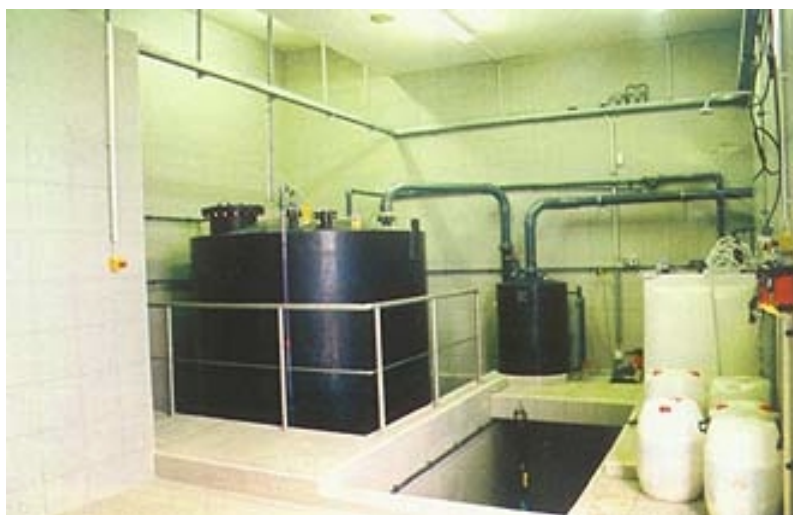
Uredaji za naknadnu dezinfekciju klordioksidom

dinci (kapaciteta 2 m 3 /s) izgrađena su samo 4 km od predviđena 42 km cjevovoda od 700 mm prema Slavonском Brodu.