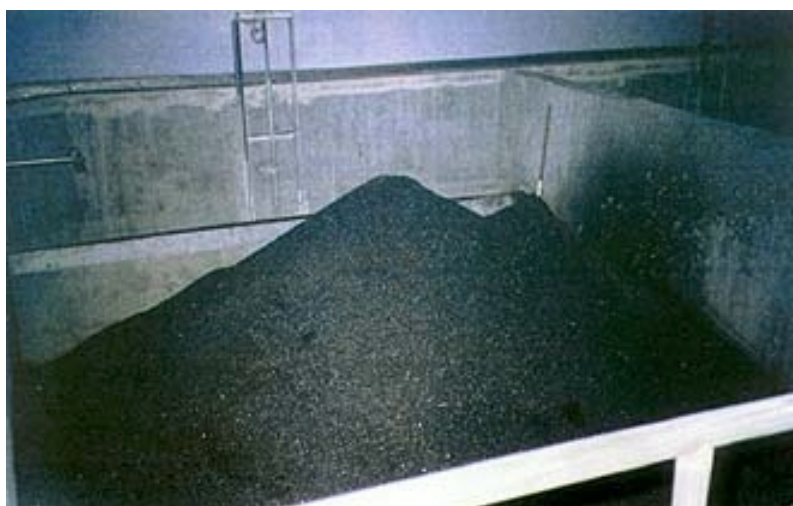
Filtri s bioaktivnim ugljenom