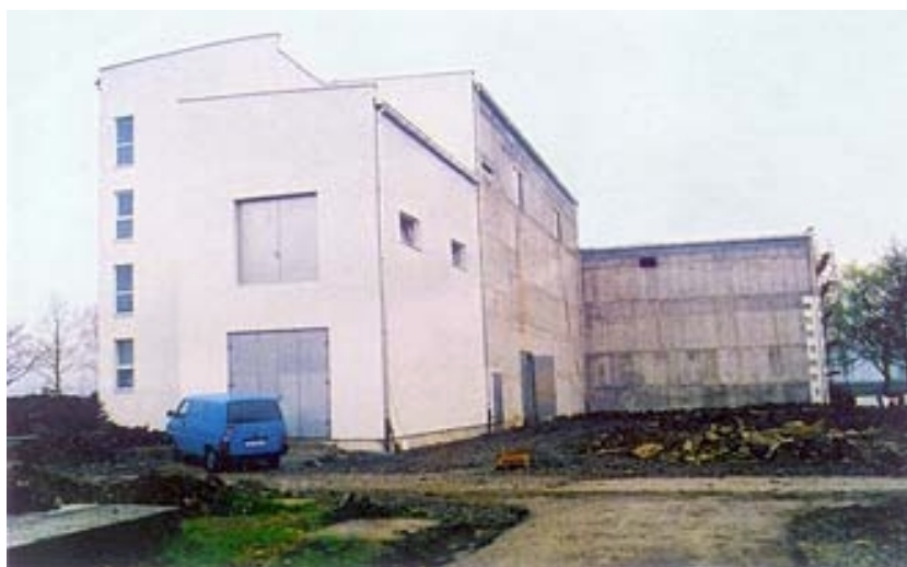
Novoizgrađena zgrada uređaja za kondicioniranje vode

dezinfekcija za mikroorganizme koje je moguće razgraditi jedino uz pomoć ozona. Za proizvodnju ozona rabi se tekući kisik, smješten u spremniku uz zgradu, blizu generatora ozona. Zagrijavanjem se kisik prevodi u plinovito stanje, a u polju visokog napona od njega se stvara ozon. Koncentracija potrebna za jednu litru vode iznosi 2,6 mg. Voda potom ide na filtraciju s biološki aktivnim ugljenom, gdje se biološki razgrađuju organski sastojci oksidirani u postupku ozonizacije. Visina je aktivnog ugljena 2,5 m (na tankom nosivom drenažnom šljunčanom sloju), filtara