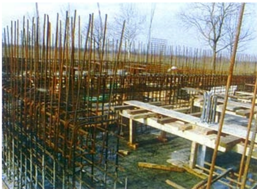
Početak radova na zgradi uređaja iz rujna 1999. godine

Kada se krenulo u nabavku novog postrojenja za preradu pitke vode, nije se znalo koju tehnologiju odabrati, rekao nam je ing. Grgić. Odlučeno je da se postave pilot-uređaji i ispitivanja su trajala šest mjeseci, a u svojim ih je laboratorijima obavljala Thyssen Aqua Engineering GmbH iz Salzburga. Na temelju dobivenih rezultata došlo se do 7 mogućih tehnoloških rješenja, od čega su 3 razmatrana zbog povoljnijih gospodarskih značajki. Od ta tri odabrano je ono srednje, a potom su Hrvatske vode (koje su investitor cijelog projekta), Vodovod iz Slavenskog Broda i Fakultet strojarstva i brodogradnje (pod vodstvom prof. dr. sc. Nikole Ružinskog) izradili ponudbenu dokumentaciju i razradili tehnološko rješenje. Na međunarodni natječaj za izvođača radova javile su se četiri tvrtke, a izabrana je AEE (Austrian Energy Environment) iz Austrije, koja je ponudila povoljan zajam s rokom otplate od deset godina, a ukupna je ugovorena cijena 103,5 milijuna austrijskih šilinga (više od 50 milijuna kuna). Projekt su izradi-