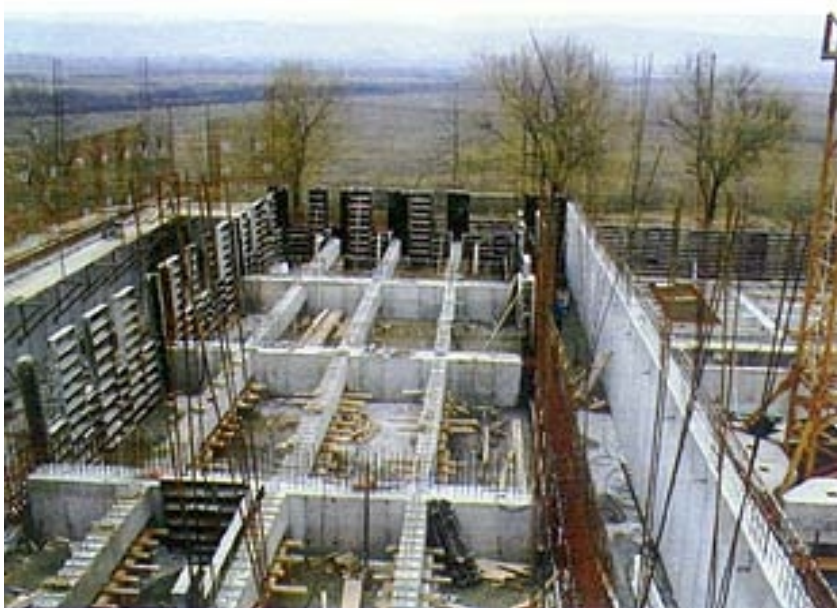
Temeljenje zgrade uređaja u listopadu 1999. godine